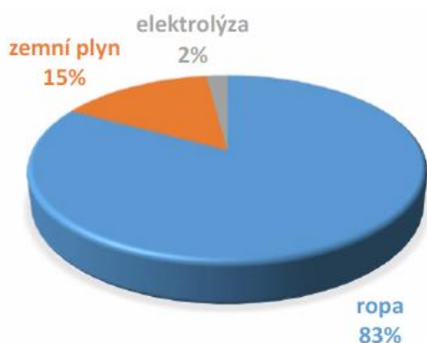
Obr. 1 Podíly hlavních surovin používaných v současné době k výrobě vodíku v ČR

Podíly hlavních surovin používaných v ČR k výrobě vodíku znázorňuje obr. 1 [9].