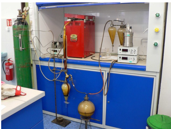
Obr. 1 Laboratorní pyrolýzní jednotka

Pro pyrolýzní testy byly zvoleny vzorky hnědého uhlí ze severočeské hnědouhelné pánve s obsahem popela v rozmezí 5 - 50 % hm. v sušině, obsahem síry v rozmezí 0,45 - 2 % hm. v sušině a obsahem dehtu v hořlavině v rozmezí 19,5 - 26 % hm. Vzorky uhlí byly po odběru z různých míst uhelné sloje upraveny na vhodnou zrnitost pro vsázku do laboratorní pyrolýzní jednotky a byly stanoveny jejich základní kvalitativní parametry a obsah arsenu. Arsen a síra jsou prvky, které negativně ovlivňují životní prostředí nejvíce a jsou sledovány podle platné legislativy České republiky. Stejně parametry pak byly stanoveny v jednotlivých produktech pyrolýzy (s výjimkou plynu, který byl přímo spalován v laboratorním hořáku) získaných z procesu pyrolýzy vzorků uhlí. Při realizovaných pyrolýzních testech byly rovněž zjišťovány hmotnostní bilance jednotlivých produktů. Ze získaných výsledků byla vypočtena distribuce a rozložení arsenu a síry obsažených