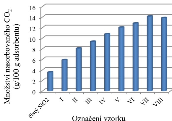
Obr. 2 Sorbované množství oxidu uhličitého po statickém experimentu při 30 °C

polyethyleniminu, proto bude vhodné pokusit se do porézního systému modifikovat vyšší množství polyethyleniminu a tento trend potvrdit. Na Obr. 2 jsou znázorněny sorpční kapacity pro CO 2 u všech testovaných materiálů.