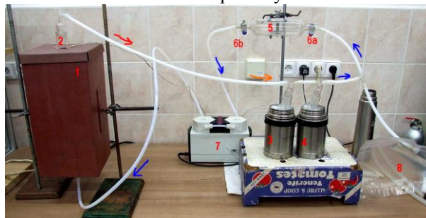
Obr. 2 Foto experimentální aparatury

1 – elektrická pec, 2 – skleněný sušící reaktor s fritou, 2a-vzorek sušeného materiálu 3 a 4 – promývací baňky v chladicích lázních (0 °C), 5- skleněná plynová vzorkovnice, 6a,6b- kulový kohout skleněné plynové vzorkovnice, 6b – regulátor průtoku sušícího vzduchu, 7 - membránové čerpadlo, 8 - akumulátor plynu (tedlarový plynotěsný vzorkovací vak, 2 l), 9 - regulace ohřevu sušící pece