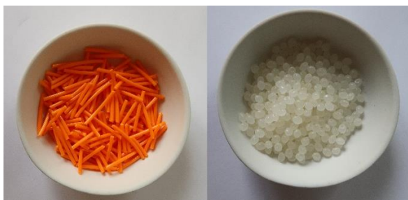
Obr 1: Zkoumaný materiál PLA: filament pro 3D tisk (OP), vlevo; panenský PLA (CP), vpravo

Pro tepelné zpracování byla použita jednobarevná odpadní PLA z vláknové PLA běžně využívané jako filament pro 3D tisk (obr. 1). Odpad byl nastříhán na kousky o velikosti zhruba 1–3 cm a podroben základní analýze (tab. 1). Podle očekávání obsahoval sledovaný odpad málo vody a popela, naopak vysoké procento hořlaviny. Vzhledem k vysokému obsahu kyslíku nebyly hodnoty spalného tepla a výhřevnosti tak vysoké jako je tomu u klasických plastů, v souladu s údaji [16]. (Vysoký obsah kyslíku, téměř v poměru 1:1 k obsahu uhlíku, je dán výrobním postupem – termickou přeměnou laktidu a následně katalytickou polymerizací na polylaktid.) Pro porovnání je uveden i rozbor čisté PLA (pecičky 3–5 mm, Sigma Aldrich, s.r.o.) a lehké frakce plastového směšného odpadu (LPO).