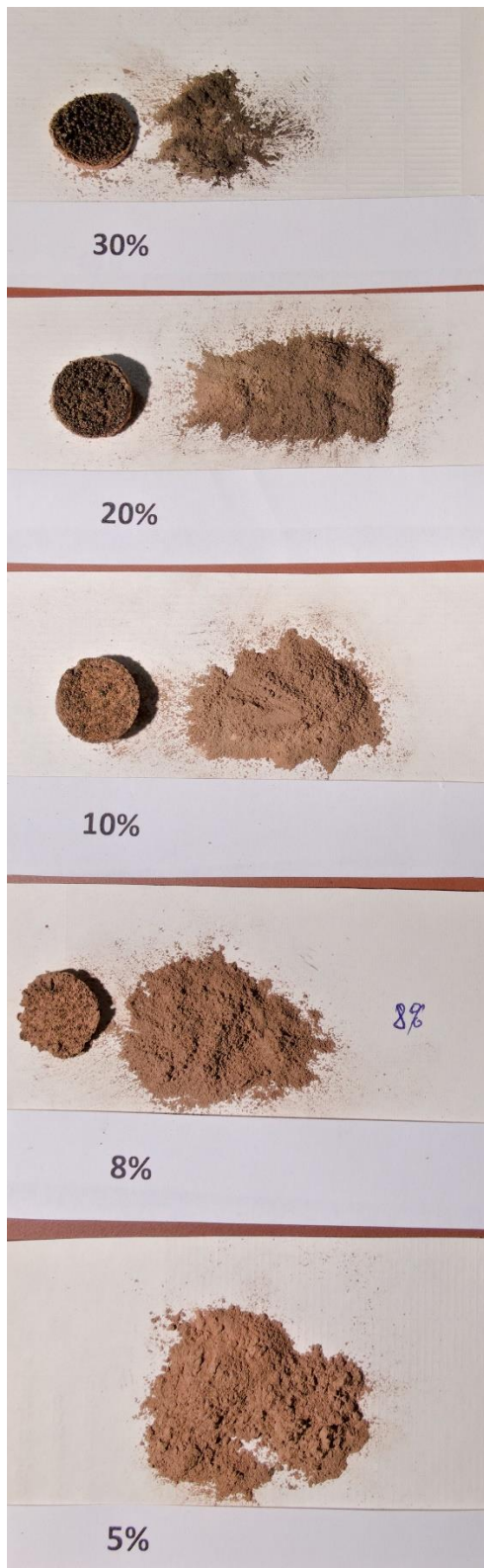
Obr. 3: Zůstatky vzorků směsí s různým obsahem minerálních látek po kalorimetrické zkoušce; procentuální hodnoty u vzorků představují obsah uhlí v dané směsi. Fig. 3: Residua of samples with different amount of mineral matter after calorimetric tests; percentage values represent content of coal in the given sample.

Při zkouškách směsi se zastoupením 50 % obou složek pak již v kelímku zůstal pouze „spečený zbytek“ – bez práškového podílu. To evidentně vypovídá o vyhoření vzorku v celém objemu navážky. Takovéto zjištění plně koresponduje s prokázanou závislostí účinnosti spálení uhlí na obsahu minerálních látek (viz obrázek 2), kdy směs se stejným hmotnostním zastoupením obou složek shořela ještě úplně ( \eta = 100\% ), ale při vyšším obsahu minerálních látek již efektivita shoření \eta klesá.